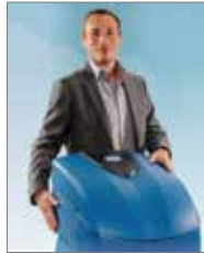
AQA Perla von BWT