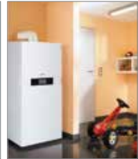
VITODENS 333F von Viessmann

Notdienst / Kundendienst Tel. 0172-787 56 20