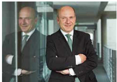
Kai Wegner MdB

Von Kai Wegner- Für Spandau im Bundestag