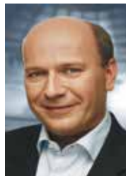
Von Kai Wegner Ihr Spandauer Bundestags- abgeordneter

Zudem muss die Polizei weiter personell gestärkt werden. „Mit mehr Beamten könnte man deutlich mehr bewirken, etwa Streifen in Wohngebiete schicken und schneller ermitteln“, so Kai Wegner. Die Polizeikräfte müssen nach Überzeugung von Kai Wegner auch mehr technische Möglichkeiten bekommen, um die Verbrechen aufzuklären. Dazu gehören die Telefonüberwachung von Verdächtigen und ein automatischer Datenabgleich mit den Nachbarländern, denn viele Banden operieren über die Landesgrenzen hinweg. Zudem tritt Wegner dafür ein, im Strafrecht bei Einbrüchen die sogenannten minder schweren Fälle zu streichen. „Dann gibt es für die Täter keine Bewährungsstrafen mehr. Wer des Einbruchs überführt fährt, muss in jedem Fall ins Gefängnis.“