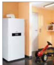
VITODENS 333F von Viessmann

Notdienst / Kundendienst Tel. 0172-787 56 20