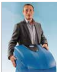
AQA Perla von BWT